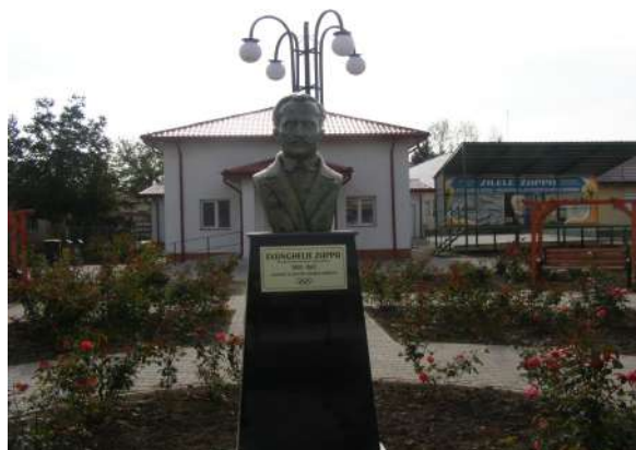
Arhiva D.J.C. Ialomița

● Urmărirea lucrărilor autorizate de Comisia Națională de Arheologie din cadrul Ministerului Culturii din județul Ialomița: