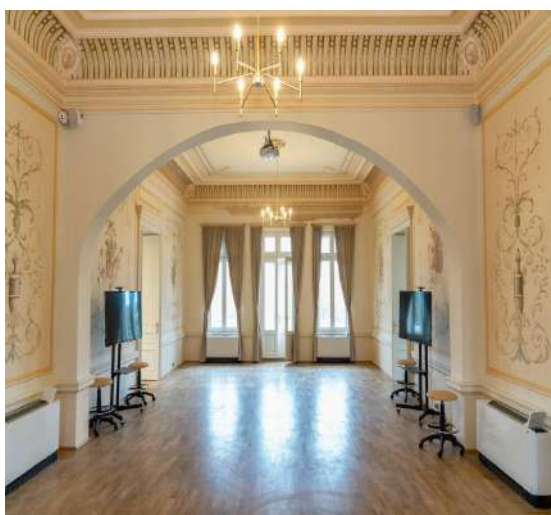
Conacul Bolomey, Cosâmbești

1. Reabilitarea monumentului istoric și de arhitectură „Conacul Bolomey”, cod L.M.I.: IL-II-m-A-14106.01, sat Cosâmbești, comuna Cosâmbești, recepție la terminarea lucrărilor.